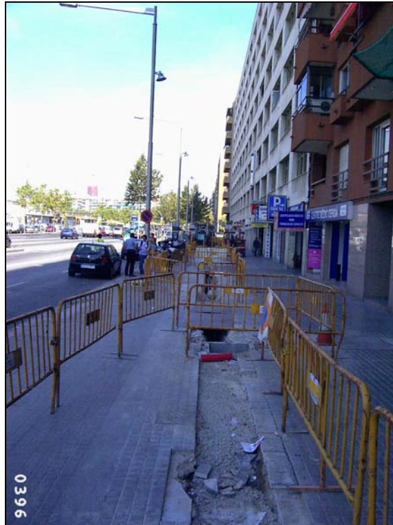
F3: Vista parcial del traçat de la rasa a la Gran Via.