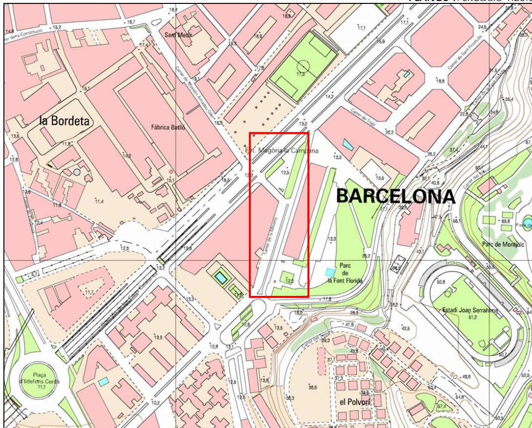
PLÀNOL 2: Situació 1:5.000