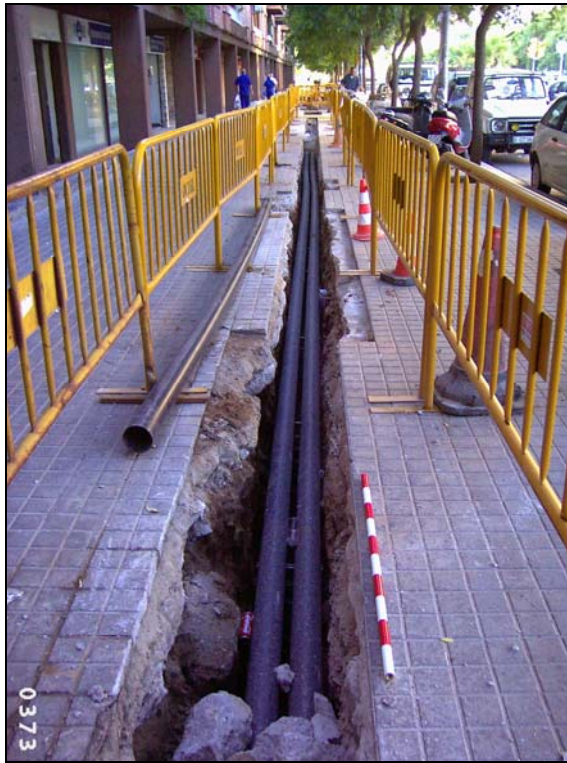
F1: Vista parcial del traçat de la rasa al carrer Minería.