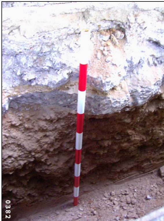
F2: Detall de la secció de la rasa.