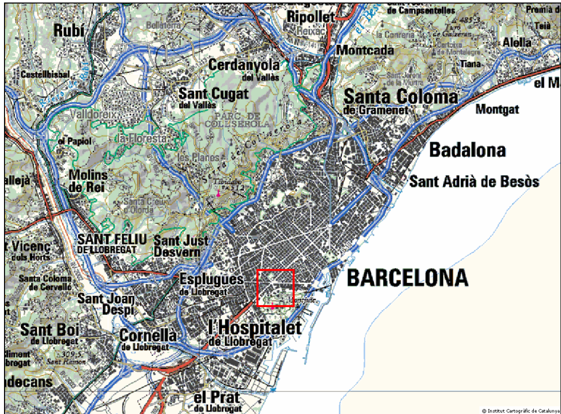
Mapa de situació 1:100.000