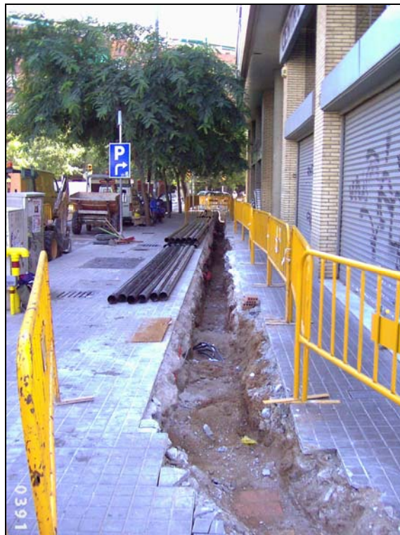
F4: Vista parcial del tram entre els carrers Minería i Gran Via.